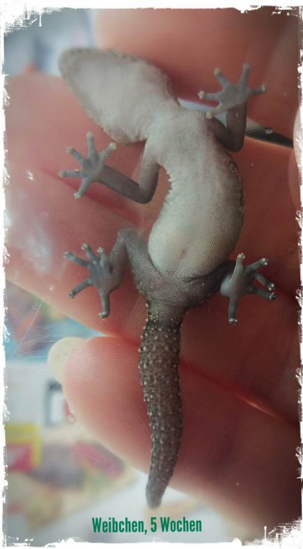
Weibchen, 5 Wochen