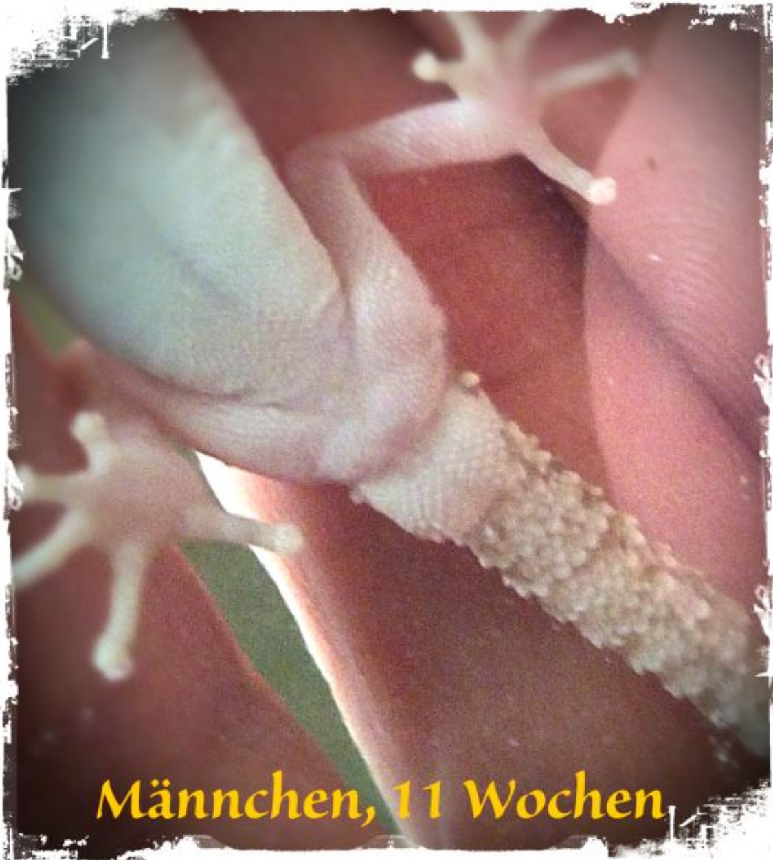
Männchen, 11 Wochen