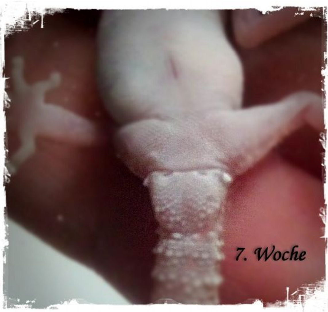
Männchen, 7 Wochen