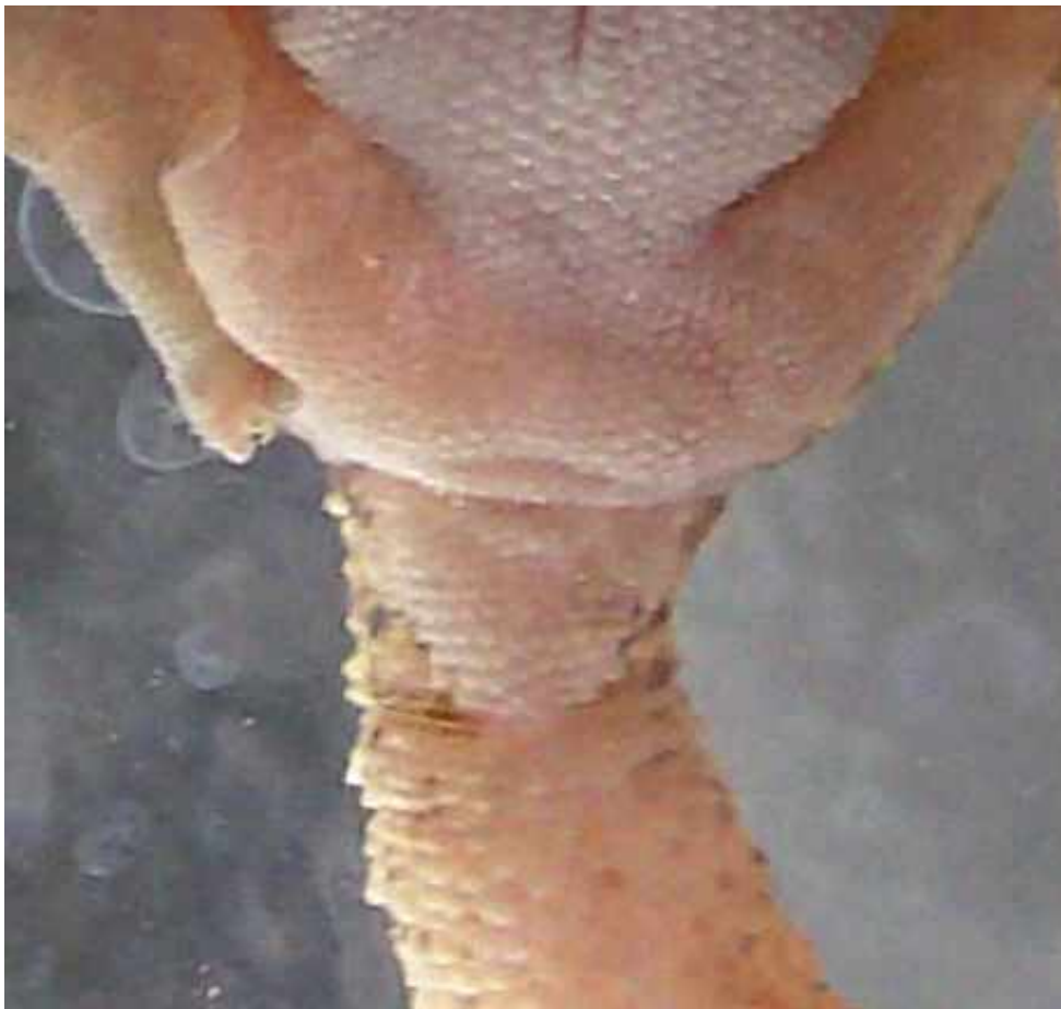
Weibchen, 12 Wochen

Madagaskar Großkopfgeckos, Hobbyzucht Bielefeld, Nachzuchten und mehr PAROEDURA-PICTA.de