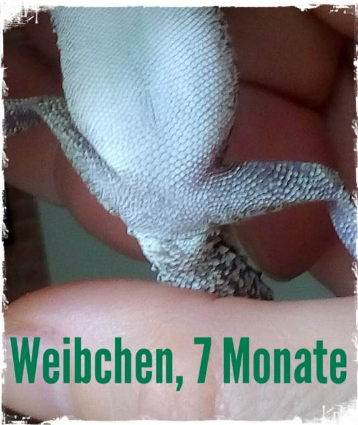
Weibchen, 7 Monate

Wenn sich die Geschlechtsreife in Gefangenschaft anbahnt, dann müssen die Männchen zwingend von den Weibchen getrennt werden, da es diese sonst stark bedrängt.