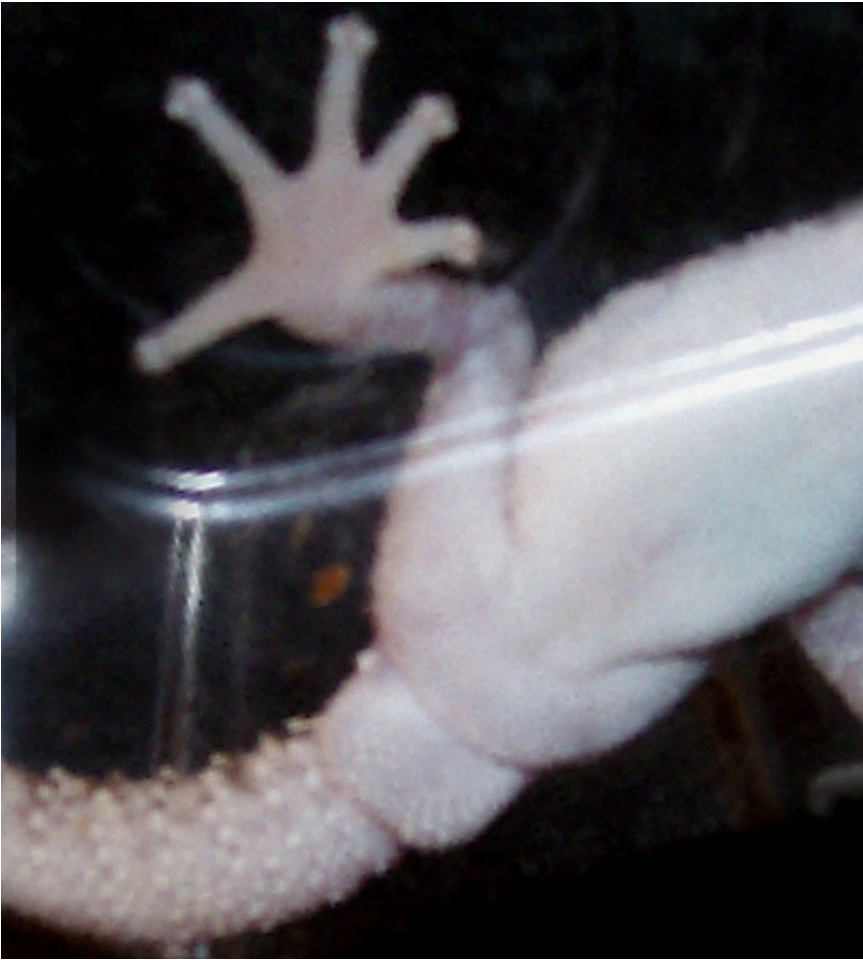
Männchen, 6 Wochen