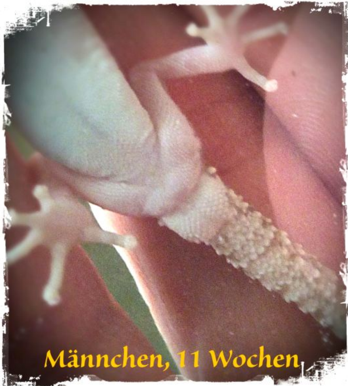
Männchen, 11 Wochen

Madagaskar Großkopfgeckos, Hobbyzucht Bielefeld, Nachzuchten und mehr PAROEDURA-PICTA.de