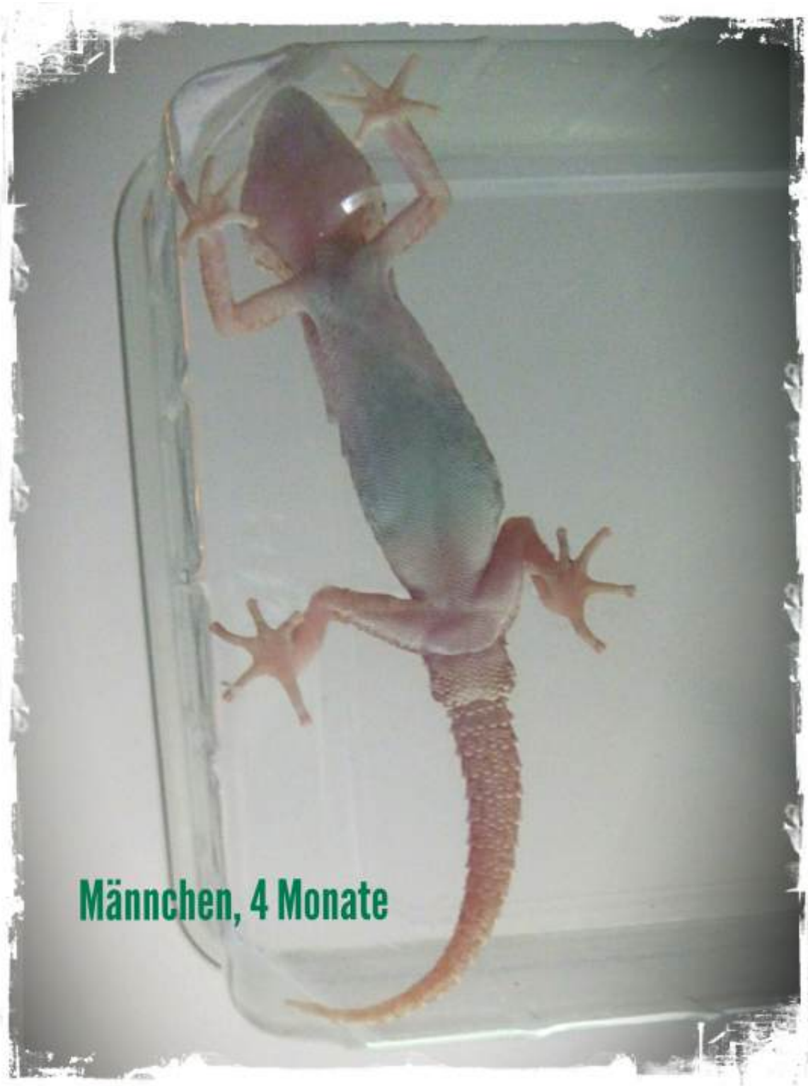
Männchen, 8 Wochen