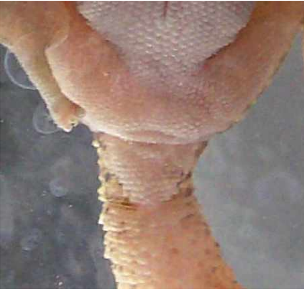
Weibchen, 12 Wochen