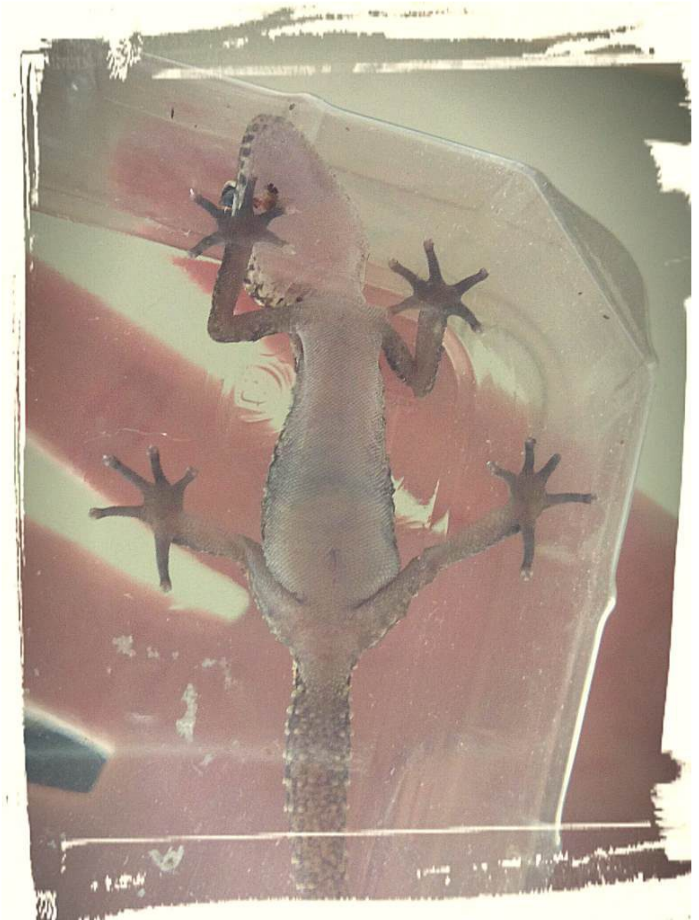
Weibchen, 7 Wochen