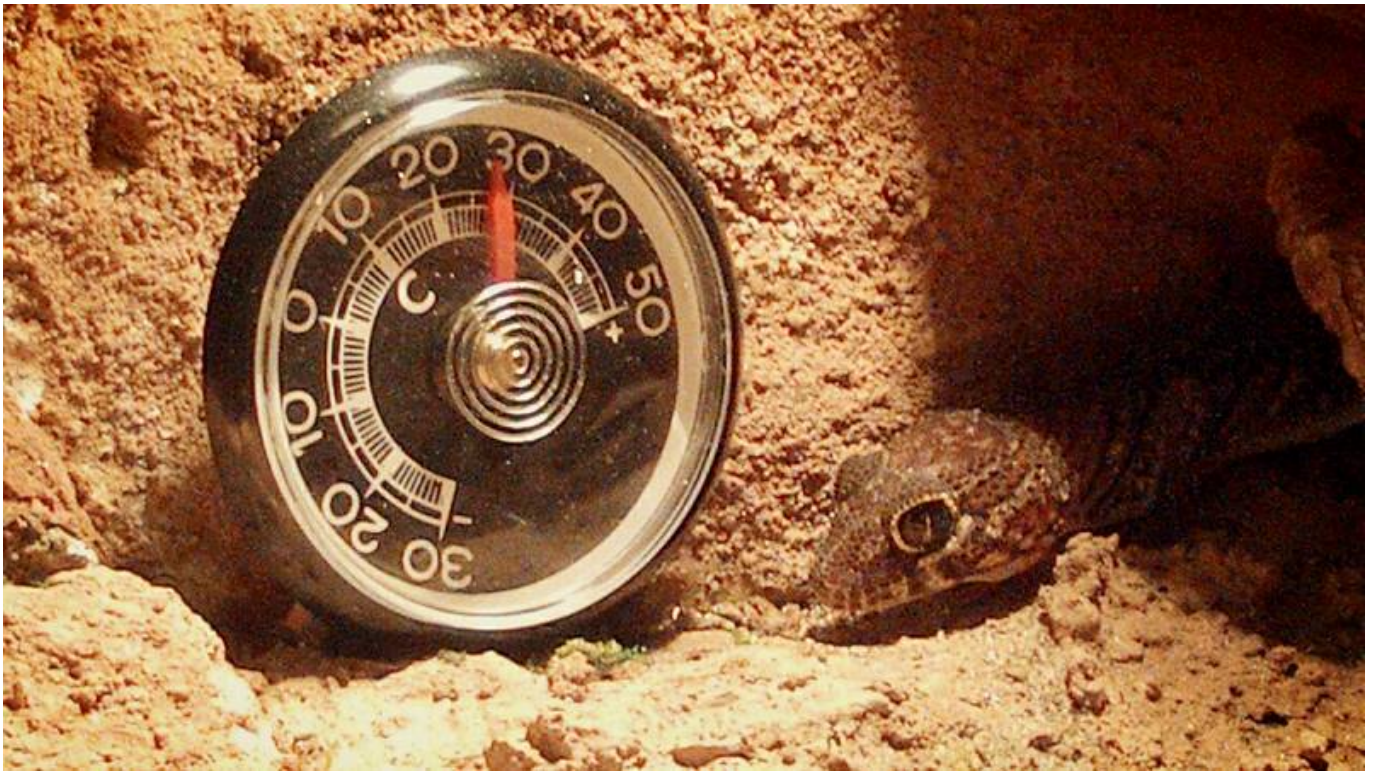
Thermometer: Temperatur zwischen 26-30°C am Tag

Höhle: Damit sich der Gecko tagsüber verstecken kann